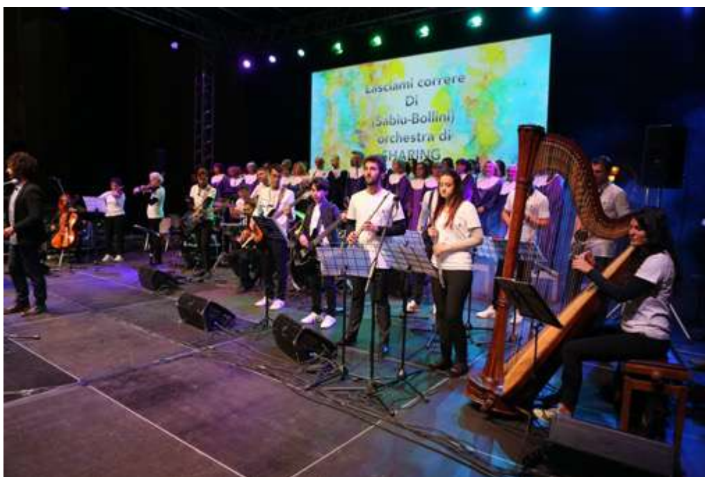
Figura 2 Sharing Breath Orchestra

Patrocini e Partner consultabili https://www.nottedirespiri.com/enti-e-sponsor/