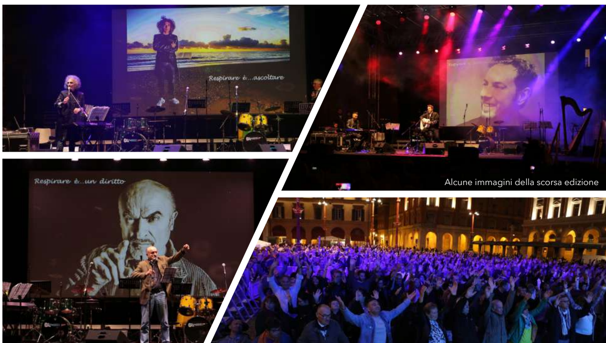
Figura 2 Alcune Immagini tratte dall'edizione 2019

Infine, torneranno ad esibirsi sul palco i vincitori del format musicale Sharing Breath 2019 nella formazione Sharing Breath Orchestra composta dai 20 musicisti provenienti da tutta Italia che lo scorso hanno condiviso il loro respiro con tutta Italia attraverso la canzone Lasciami Correre scritta da Luca Bollini , arrangiata dal Maestro Marco Sabiu e dedicata ai pazienti affetti da patologie dell'apparato respiratorio che combattono ogni giorno per essere liberi. https://www.youtube.com/watch?v=ucQLgdoVtsA